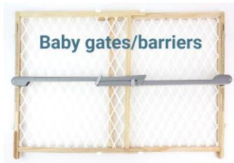
cercas/barreras para bebés

Herramientas que pueden ayudarte en el proceso de introducción: