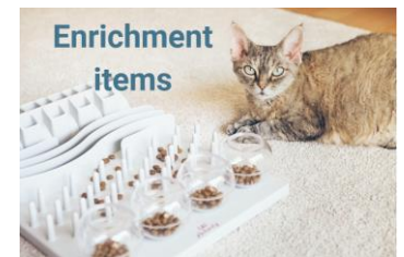
juguetes de enriquecimiento