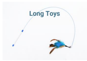
juguetes largos de vara